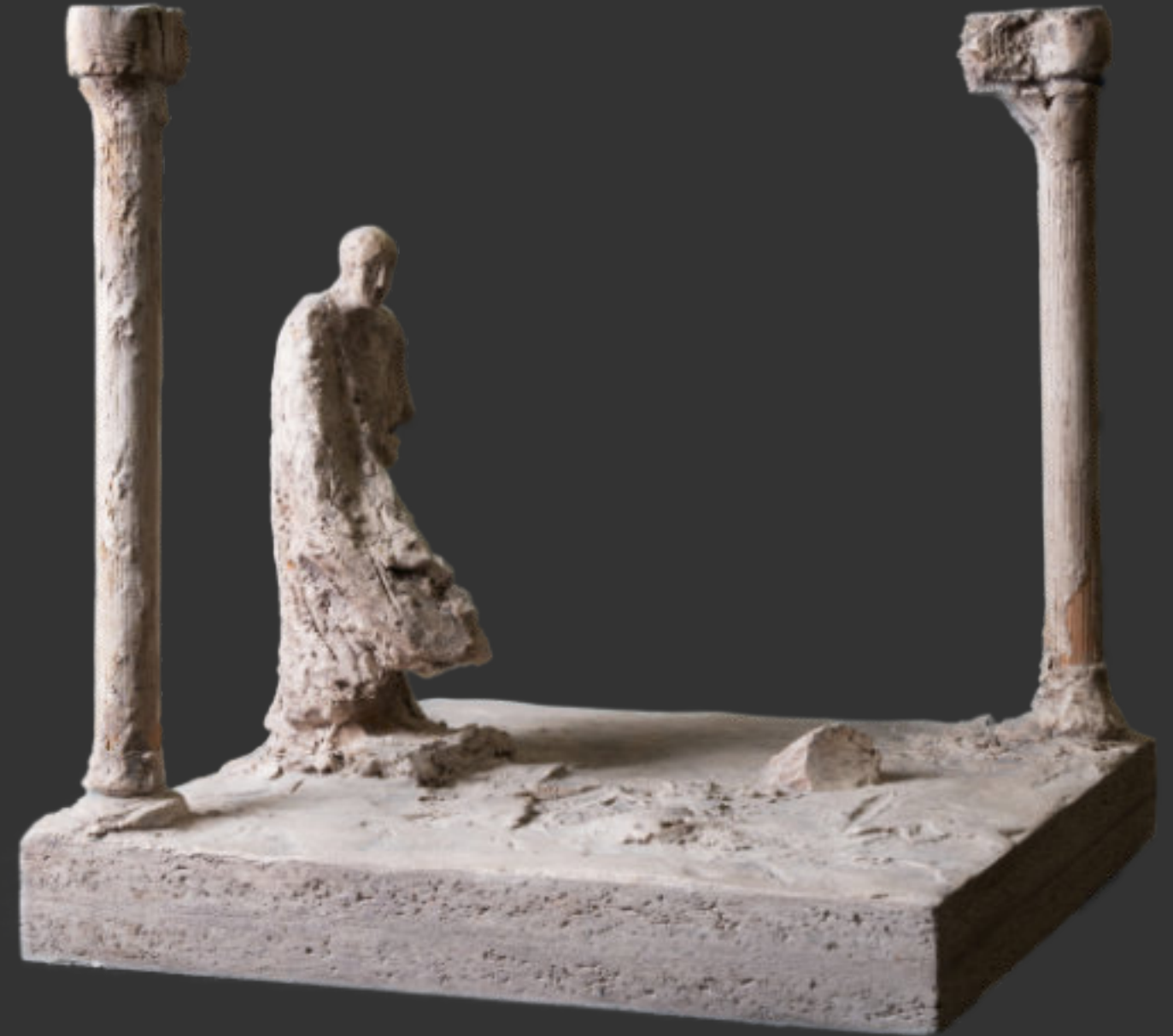
In den Ruinen - 2024 - Stuckgips, getönt - 20 x 40 x 40

Die Skulptur eines Trauernden, klein, voller Zurückhaltung und Respekt vor dem Schmerz. Ein Mensch steht und sinnt zwischen Ruinen, aber Verlust und Trauer wurde und wird zu allen Zeiten ähnlich erlebt. Die Gestalt ist verwittert, also wohl kein Zeitgenosse. Die Ruinen weisen noch tiefer zurück in die Vergangenheit, auf alle, die die Lebenden je unter die Erde gelegt haben.