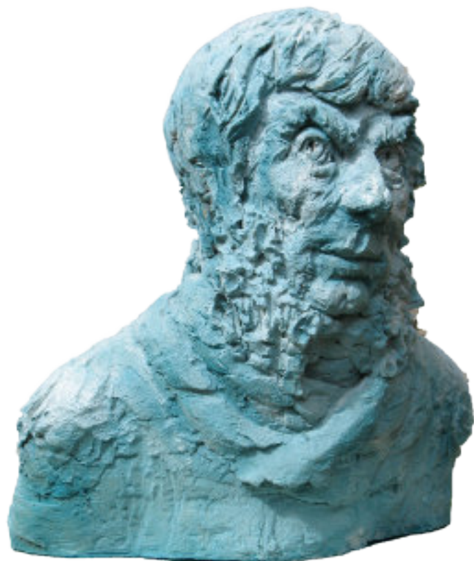
Carmen Stahlschmidt Caspar David Friedrich 2024 - Terrakotta - H 47

rührt vielleicht nicht mehr den gläubigen Christen in uns. Aber sie erwischt uns gleichwohl an einer empfindlichen Stelle – bei unserem schlechten Umweltgewissen. Friedrich hatte Respekt vor der Natur; wir hatten ihn nicht.