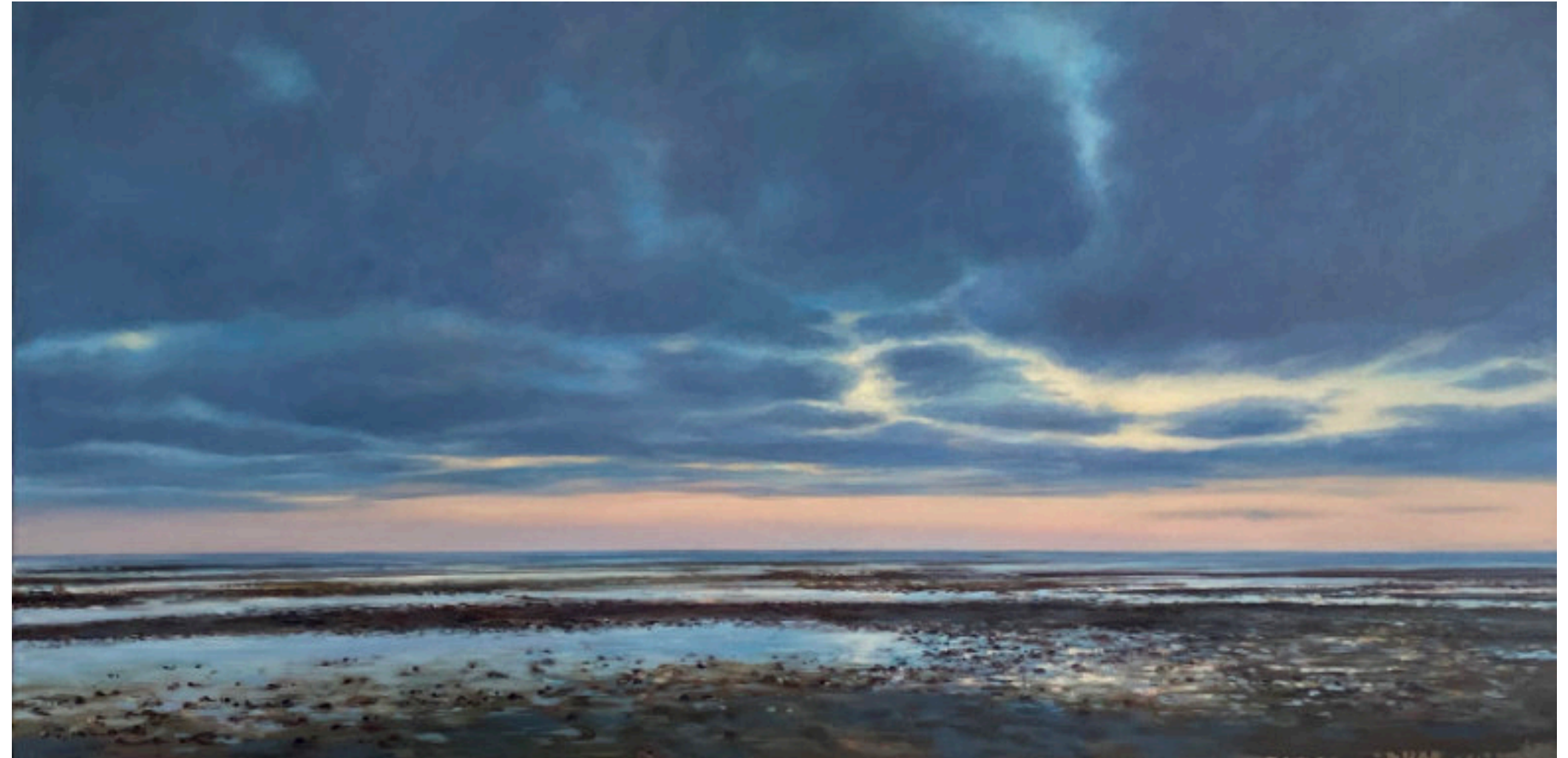
Abend im Watt - 2022 - Öl/Leinwand - 50 x 100

Ebbe und Flut, Verschwinden und Wiederkehr, Wechsel und Wandel – in Zeiten von Covid konnte diese Perspektive uns etwas entlasten.