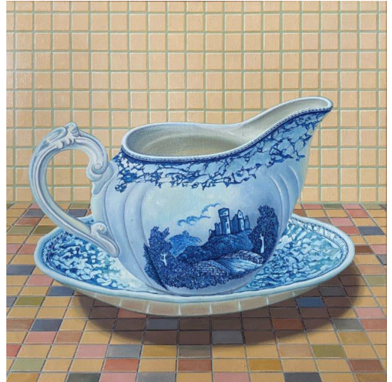
Milchkännchen - 2011 - Eitempera/Öl/Leinwand - 120 x 120