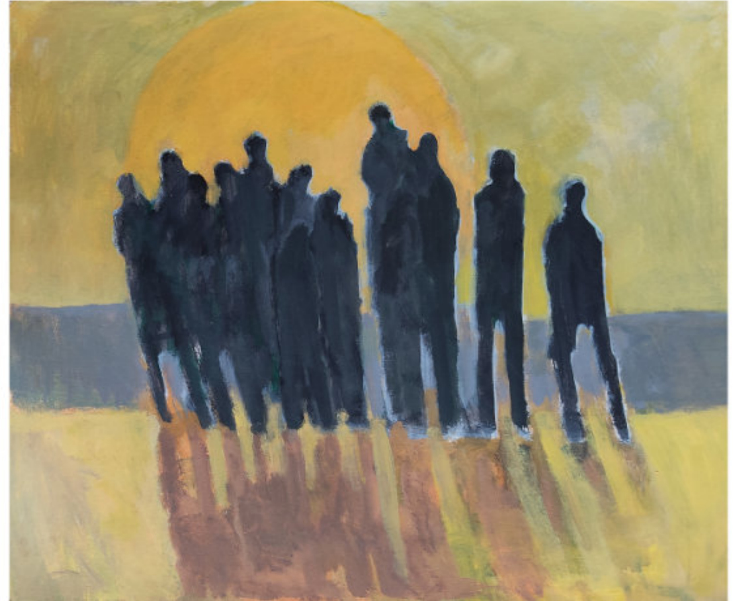
Sehnsucht nach Wärme und Erleuchtung - 2018 - Acryl/Malpappe - 70 x 84