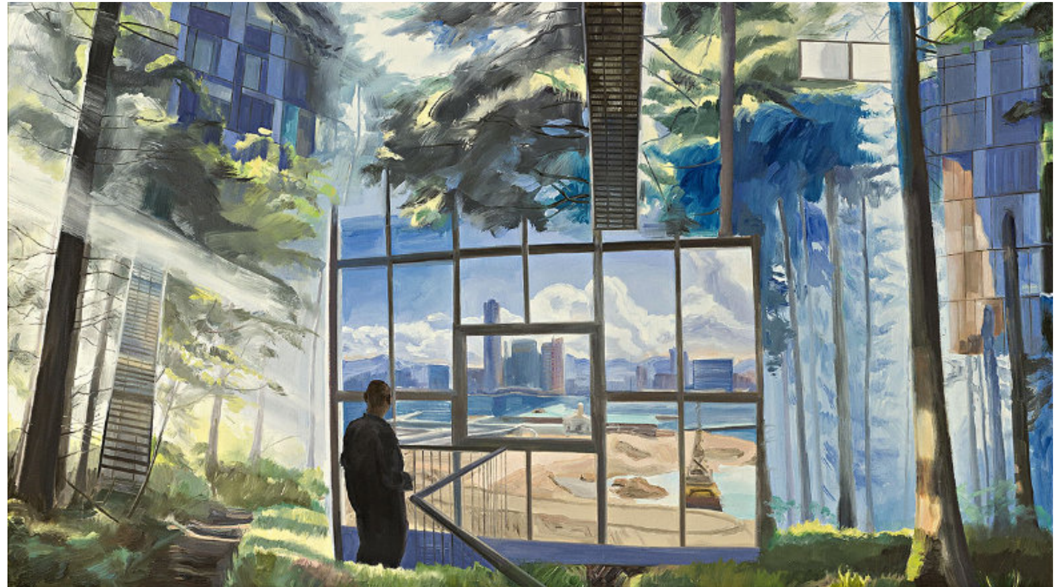
Blue Forest - 2015 - Oel/Nessel - 90 x 160

Der Betrachter dieser Überwältigungs-Show scheint jedenfalls etwas überfordert.