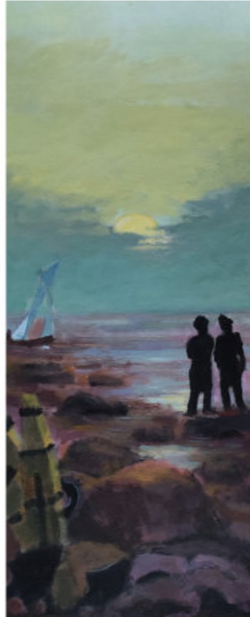
Zwei Männer in Betrachtung des Mondes von C.D.F. - 2014 - Acryl/Malpappe - 70 x 28

Bild rechts: Was kann eine so blasse Sonne diesem schwankenden Häuflein schon spenden? Alles scheint extrem zusammengestaucht wie auf einem Werbefoto mit Teleobjektiv. Statt in einen tiefen Raum schauen wir auf eine Projektionsfläche für die ganz großen Wünsche. So könnte das Logo für einen esoterischen Wellness-Guru oder für einen gesunden Brotaufstrich aussehen. Aber Neumüller malt – ohne sich darüber zu erheben – Irrwege und Sackgassen, in die wir Sehnsüchtigen uns zuweilen verrennen.