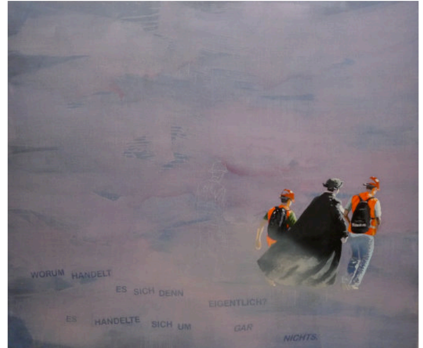
Worum geht es eigentlich? Es geht um gar nichts! - 2016 - Acryl/Leiwand - 170 x 200