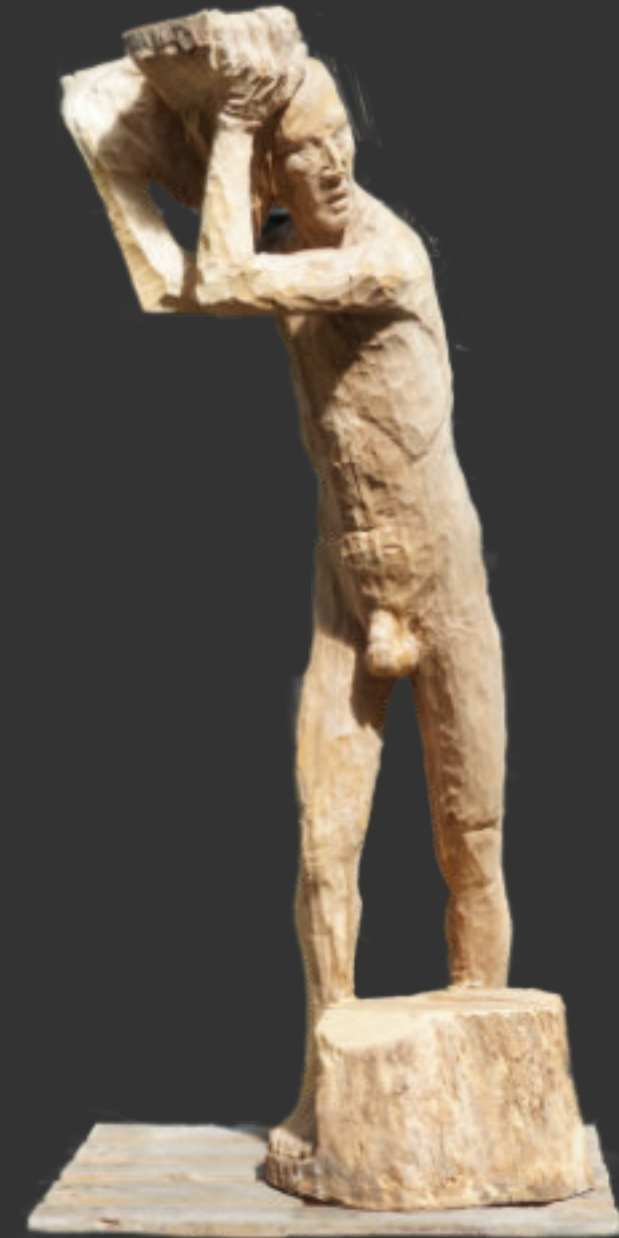
Der Philosoph, das natürliche Selbst - 2014/2024 - Walnussbaumholz - 168 x 60 x 80

Ein nackter Mann, sichtlich in intensiver Gedanken-Arbeit, auf seiner Schulter und auf dem Boden jeweils etwas Schweres. Was lassen wir, wie es ist, was nehmen wir uns und wenn ja wozu – es sind die einfachen, großen Fragen, die wir uns immer wieder stellen müssen. Wir werden nie endgültige Lösungen finden, in vielem Wesentlichen unfertig bleiben. Unsere Blöße ist offensichtlich und Bernhard Kuckens Philosoph ist nackt.