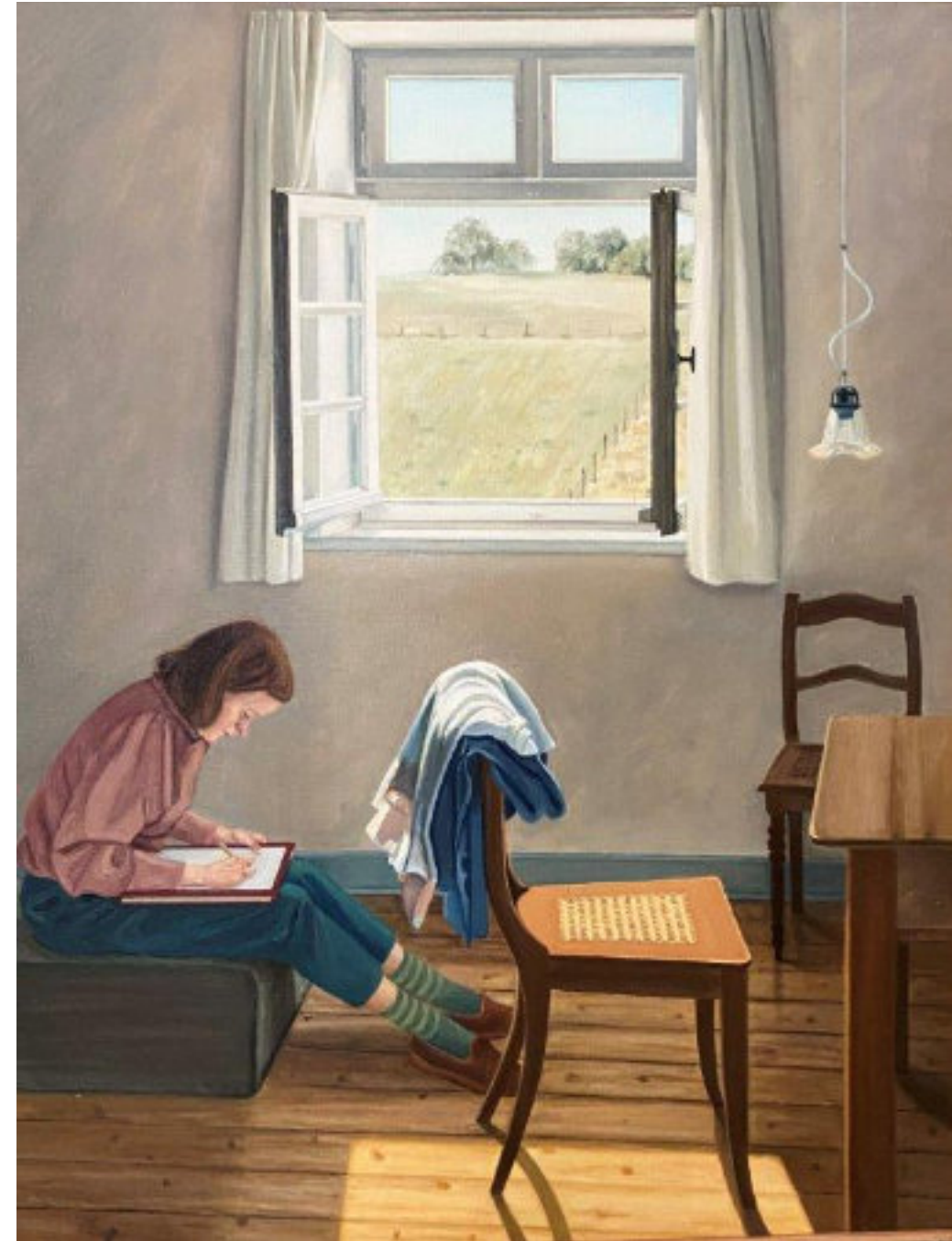
Fenster und Landschaft im Vogelsberg - 1997 - Eitempera/Leinwand - 130 x 100

Verarbeitungsstufen, Abstände, Verdichtungen, Visionen – so hat Friedrich die Natur draußen erlebt und sie im Atelier gemalt. Die junge Frau im Zimmer arbeitet auf seinen Spuren.