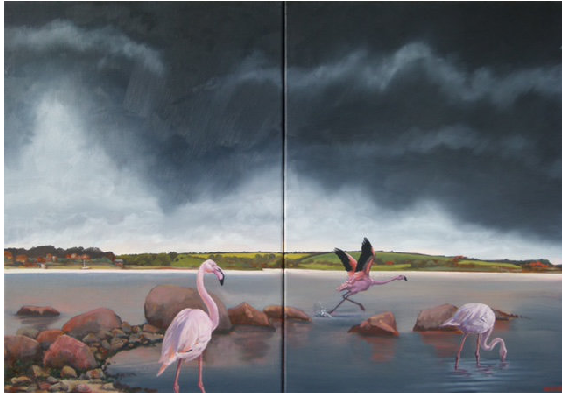
Flensburger Förde - Diptychon - 2024 - Öl/Leinwand - 70 x 100