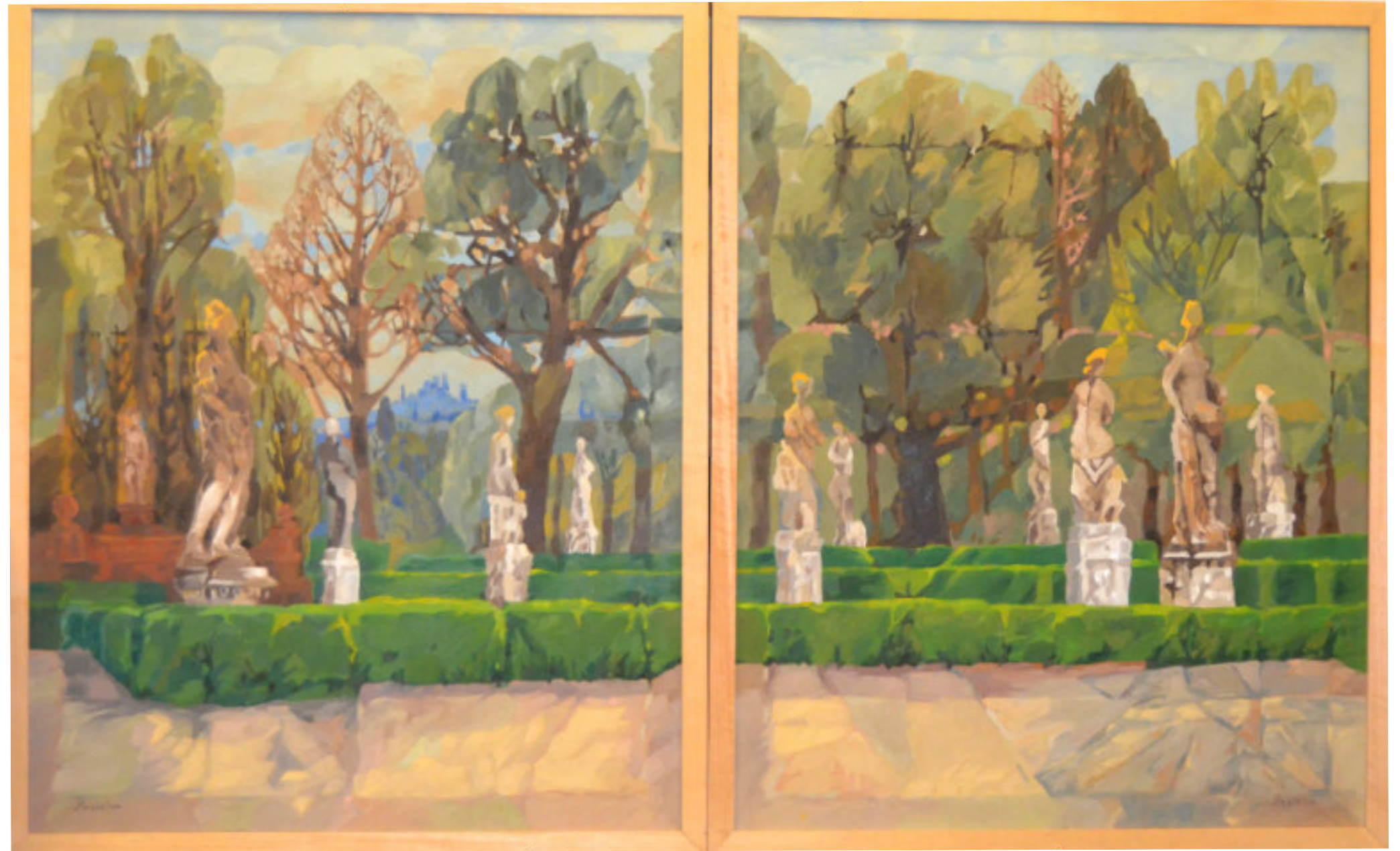
Landschaftspark - Diptychon - 1989 - Öl/Leinwand - 92 x 73

Ein symmetrisches Diptychon, ein strenges Geviert im Park. Über die luftigen Wege, Statuen, Hecken und Bäume zieht sich ein zartes Netz. Zu all dem Geordneten also obendrein die Andeutung des Rasters, mit dem Künstler seit Jahrhunderten den Malgrund aufgeteilt und portioniert haben. Dennoch wirken die beiden Bilder nicht überreglementiert und starr. Ein dunstiges Sommerlicht streichelt den Park, setzt zwischen Licht- und Schatten-Partien keine scharfen Grenzen, sondern nur sanfte Akzente. Eine Kunst-Landschaft – von Menschen geschaffen, in einem stillen Moment frei von ihm und anderen Störungen.